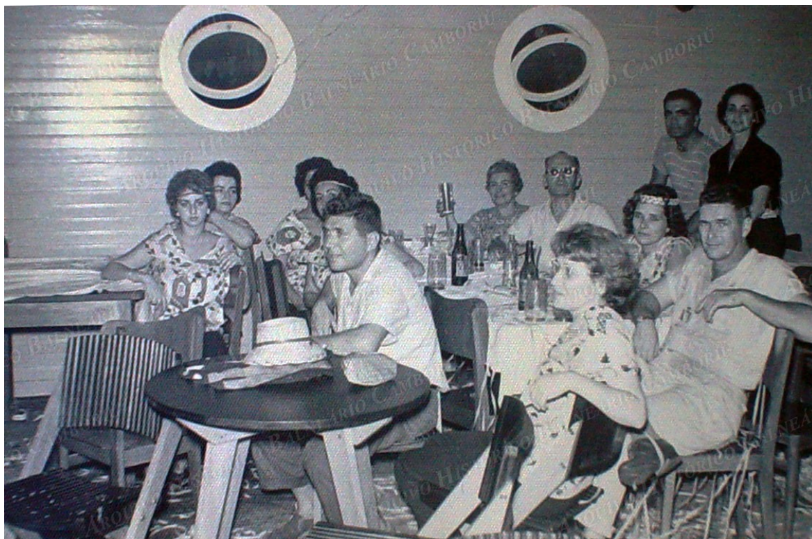
Festa de Carnaval, ano de 1960.