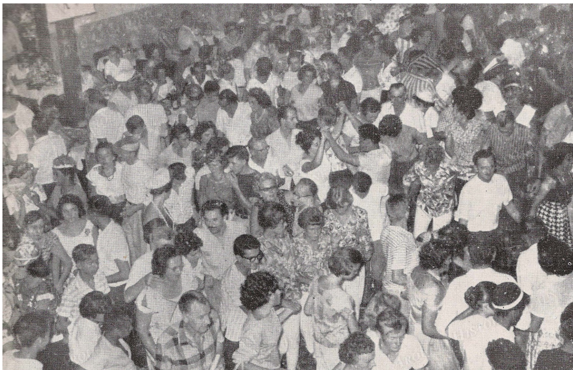
Carnaval no late Clube, ano 1962.