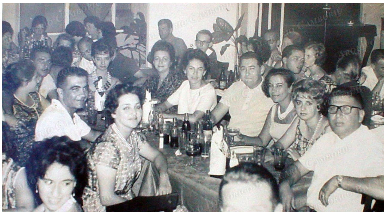
Carnaval no late Clube, ano de 1962.